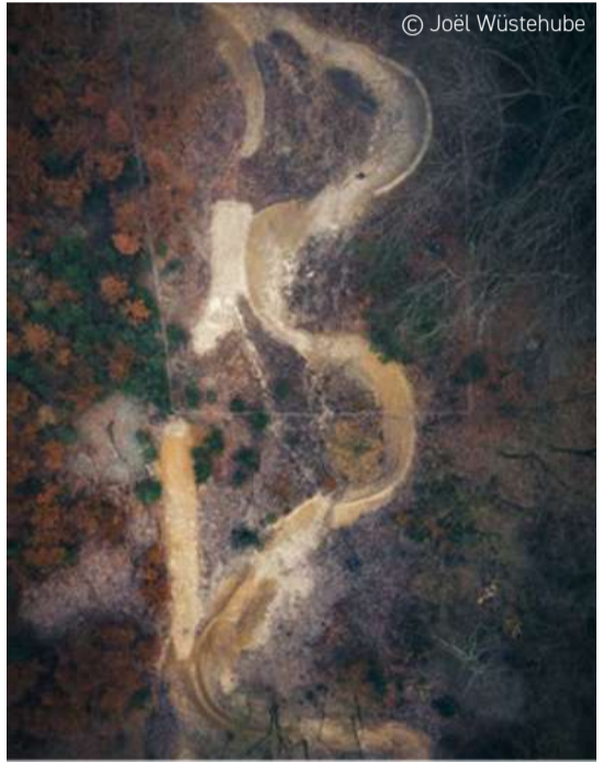
NF-Trails in Oerlinghausen am Naturfreundehaus